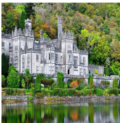
Mainistir na Coille Móire