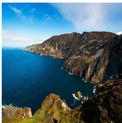
Aillte Shliabh Liag

6. Ar na háiteanna eile atá luaite tá an Seancheann i gCionn tSáile, Cuan Mó i gContae Mhaigh Eo agus Loch Té i gContae Chill Mhantáin.