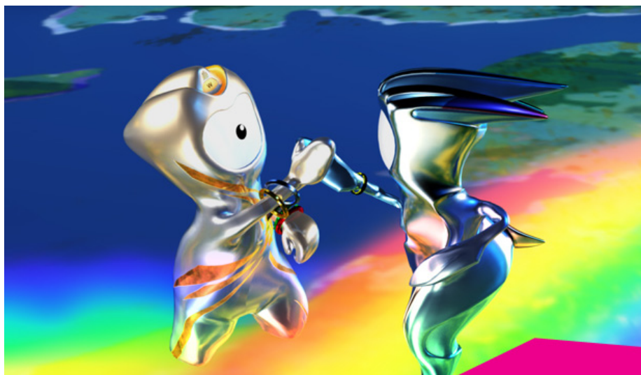
Wenlock agus Mandeville, sonóga oifigiúla na gCluichí

Cuireadh tús le Cluichí Oilimpeacha 2012 ar 27 Iúil i Londain agus chríochnaigh siad ar 12 Lúnasa. Deir an coiste stiúrtha gur baineadh úsáid as an eiteicneolaíocht chun na Cluichí a thaispeáint ar fud an domhain. Fuair tú beo ar líne iad. Ní dhearna an coiste stiúrtha dearmad ar na páistí óga ach oiread mar spreag eachtraí Wenlock agus Mandeville , sonóga oifigiúla na gCluichí, iad chun spéis a chur sna Cluichí.