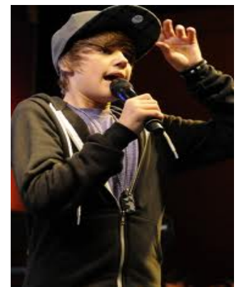
An Íomhá Nua-Aimseartha